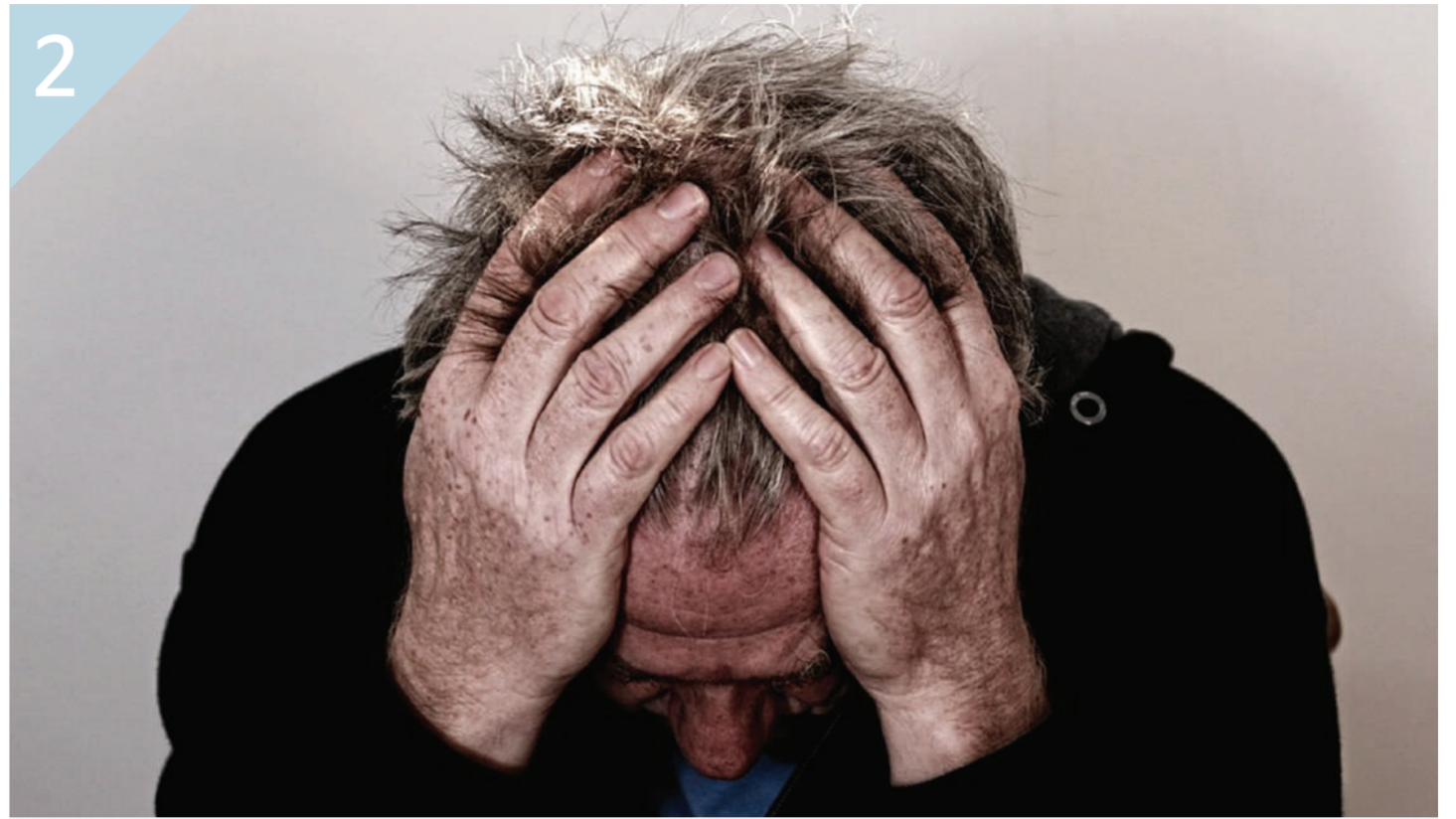
2 암으로 인한 통증 치료를 필요로 하는 분