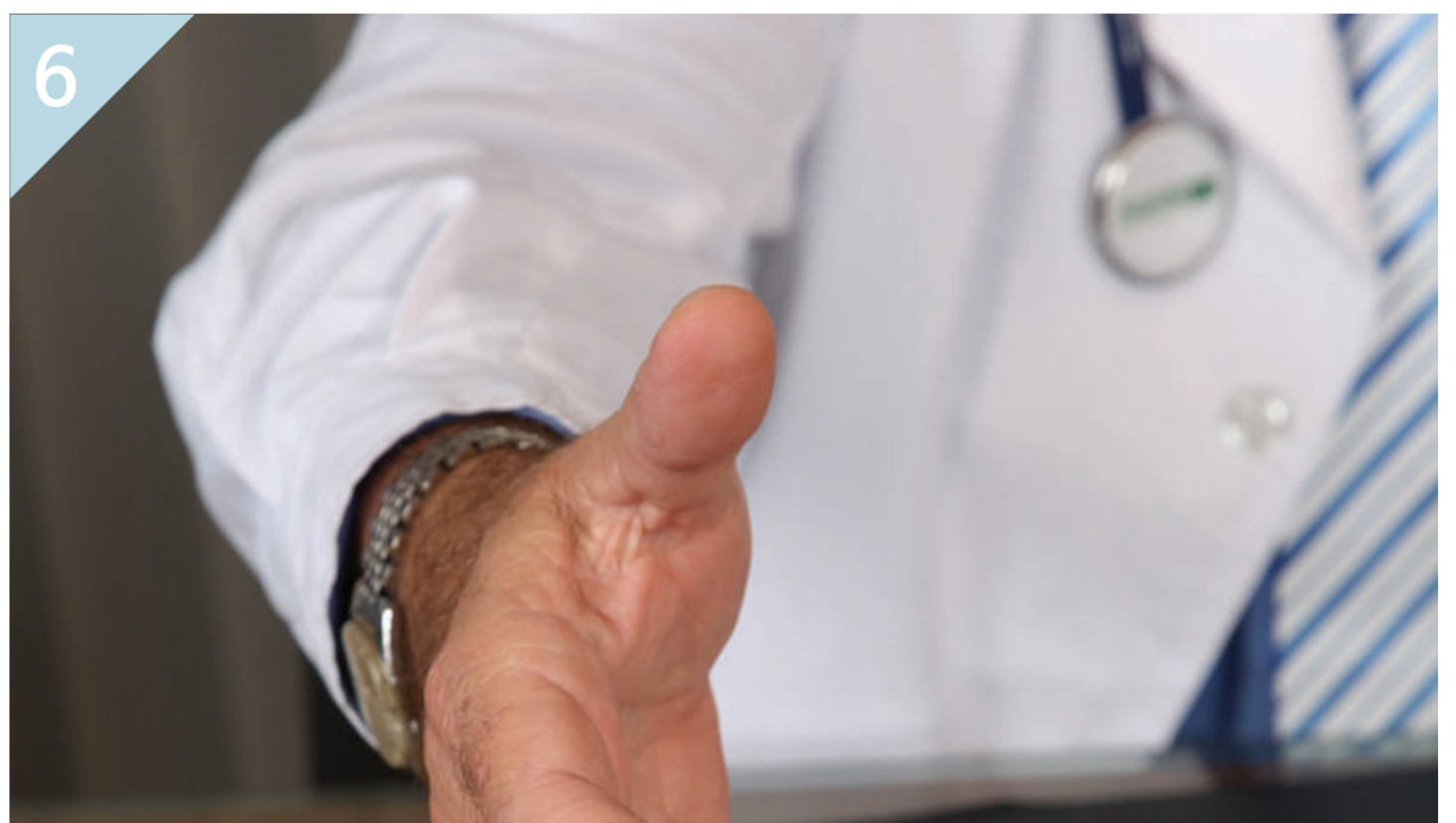
6 무엇보다도 고주파온열치료에 대해 전문지식을 갖춘 의료진과 상담 후 진행하는 것이 바람직한 치료 방법입니다.